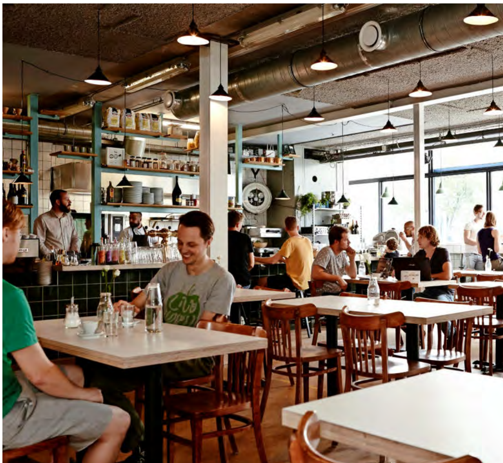
Café-restaurant De Klub

'DE CHEF WEET PRECIES WAAR DE INGREDIËNTEN VANDAAN KOMEN EN TEELT ZELF COURGETTES, POMPOENEN EN BIETEN.'